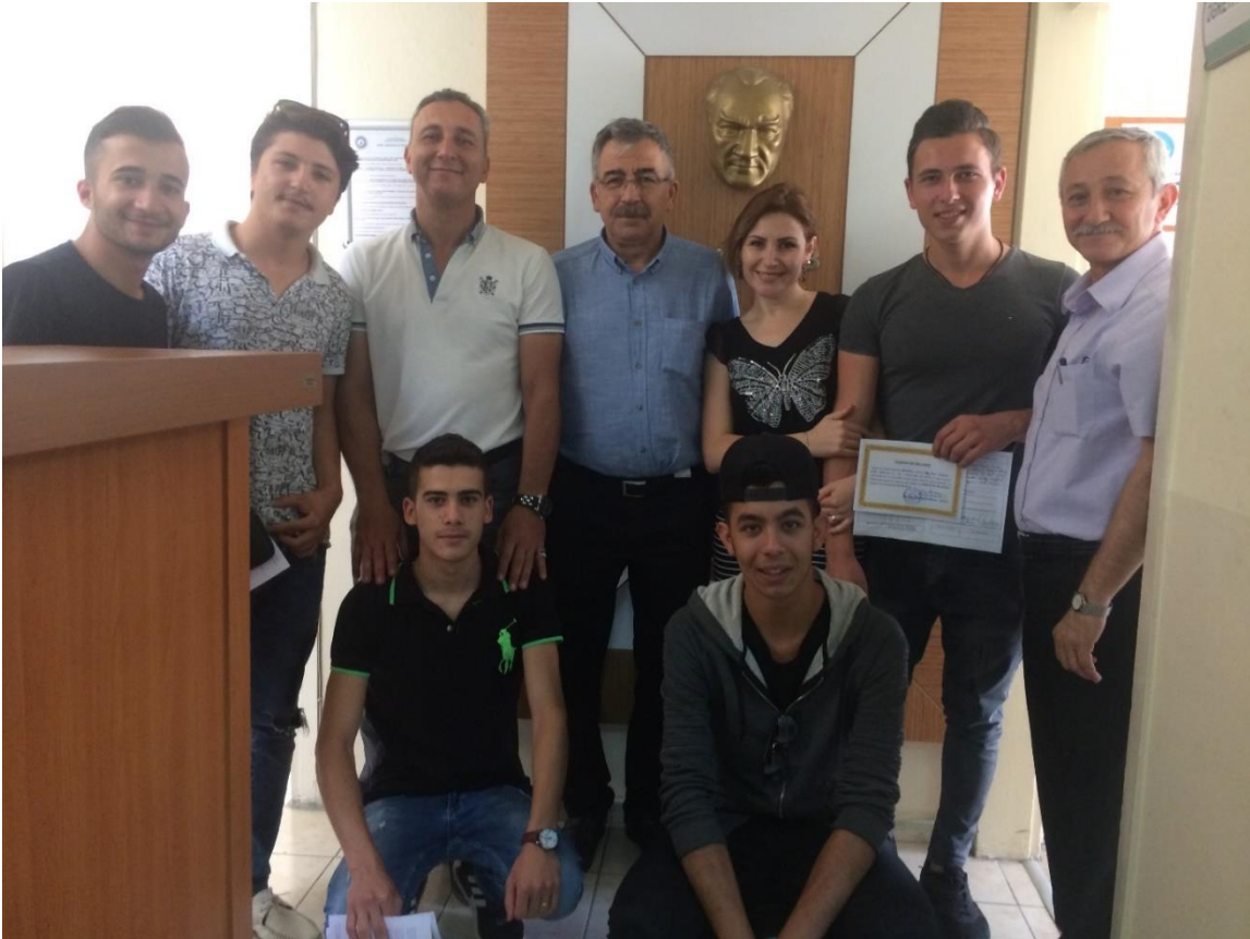
2017 Haziran Son Sınıf Öğrencilerimizden...