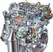
Motorlu Araçlar Teknolojisi

Çıraklık eğitimi ikili bir meslek eğitimi sistemidir. Çırak mesleğin gerektirdiği teorik bilgileri haftada bir gün Okulda, pratik bilgi ve becerileri ise, haftanın geri kalan günlerinde işyerinde öğrenir.