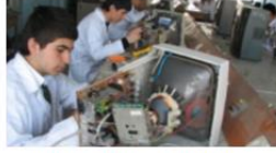
Elektrik ve Elektronik Teknolojileri