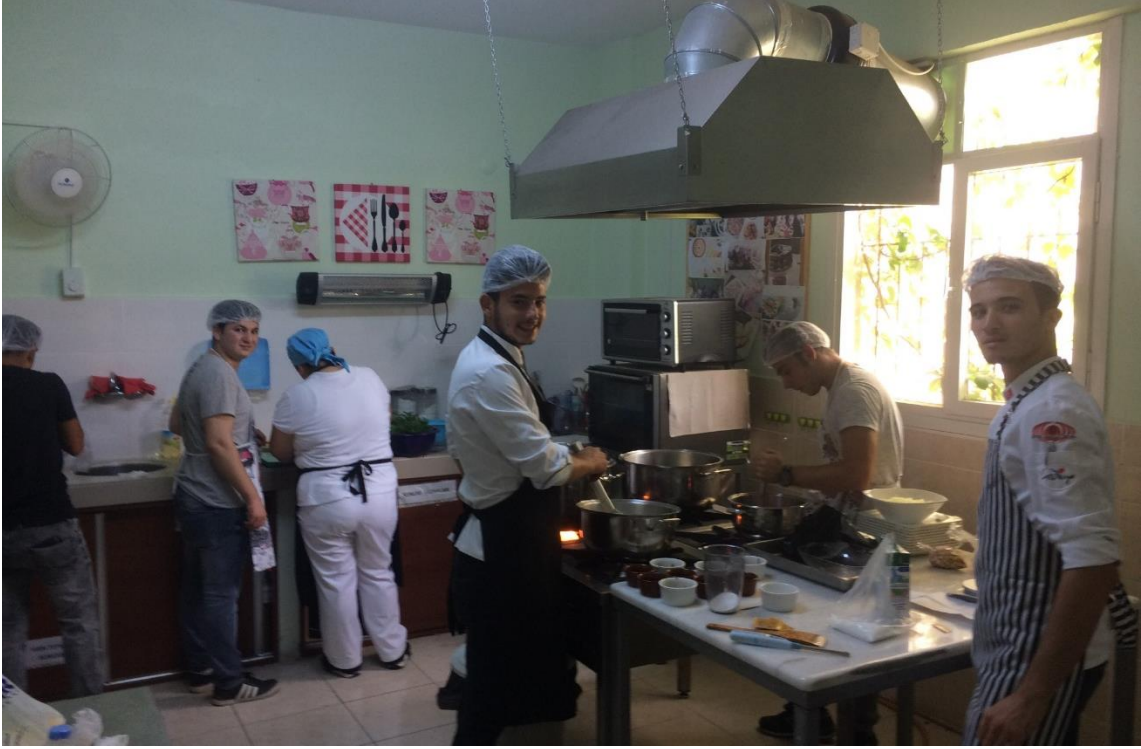
2017 Eylül Dönemi kalfalık Sınavından...