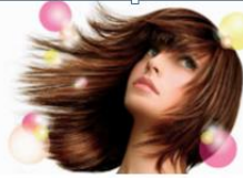
Güzellik ve Saç Bakım Hizmetleri