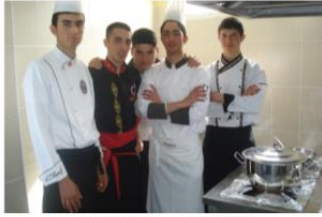
Yiyecek ve İçecek Hizmetleri