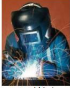
Metal İşleri Teknolojisi